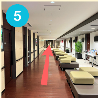
5 突き当りを右折します