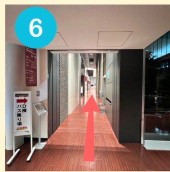
6 直進するとエントランスに到着します