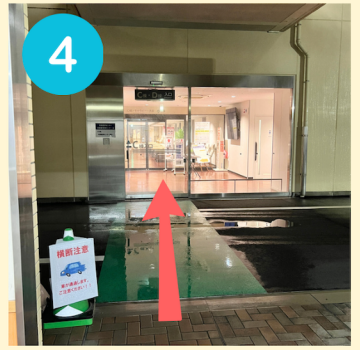
4 自動ドアを出て隣の棟に移ります