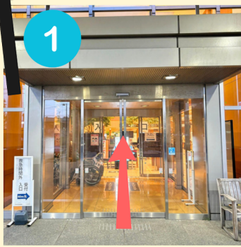
1 A棟正面エントランス