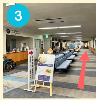
3 11番受付前を直進します